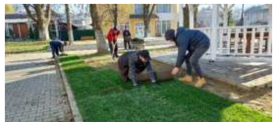
Zona „Grădina de vară”

- Zona bloc 67 S1550 mp. Montat gazon rulou 750 mp/ Semănat gazon 800 mp. Plantare Photinia 3 buc/Magnolia 3 buc./carpinus 6 buc/Cupressocyparis pompon 5 buc/ Cupressocyparis spirale 4 buc./Taxus 4 buc.