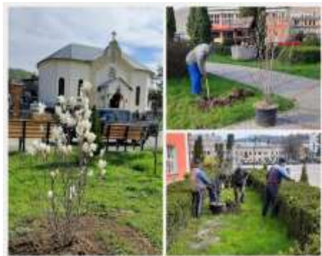
Zona Capelă și Casa de Cultură

România 425200 Năsăud Piața Unirii, Nr. 15, Tel. 0263-361026, Fax 0263-361028